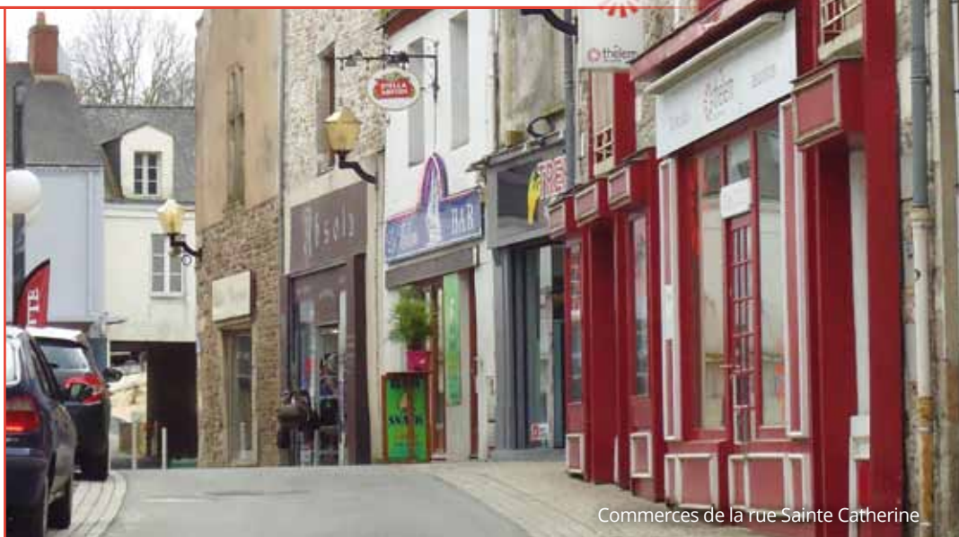
Commerces de la rue Sainte Catherine