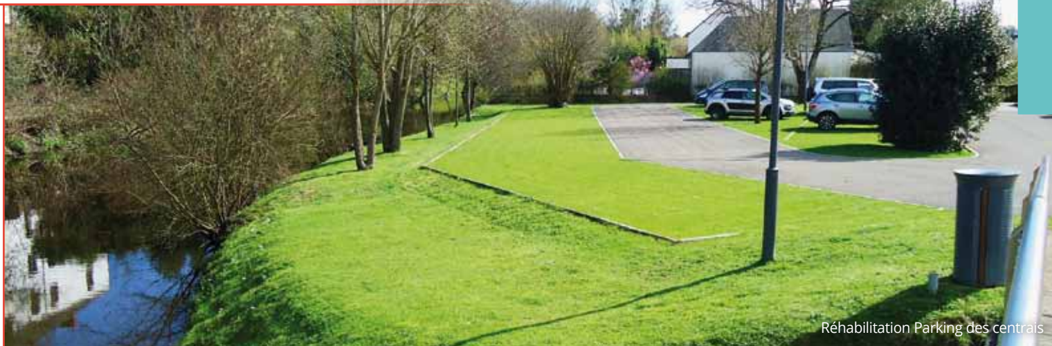
Réhabilitation Parking des centrais