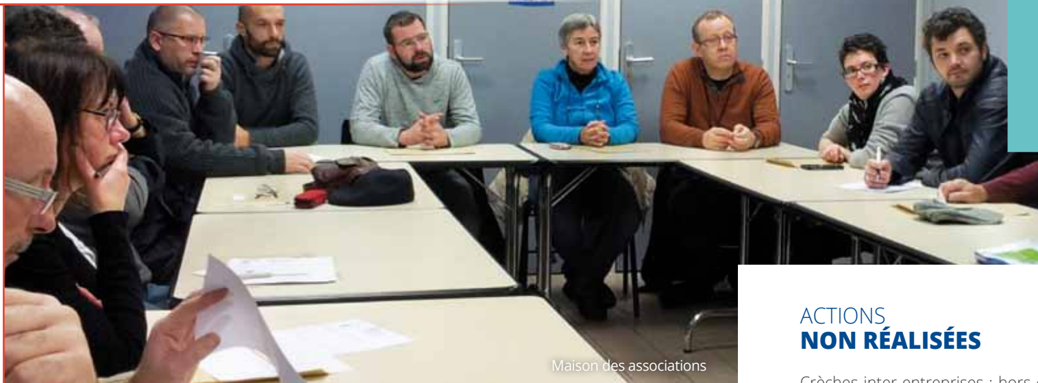
Maison des associations