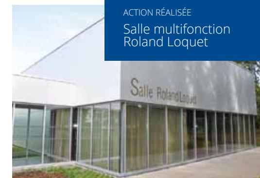
ACTION RÉALISÉE Salle multifonction Roland Loquet