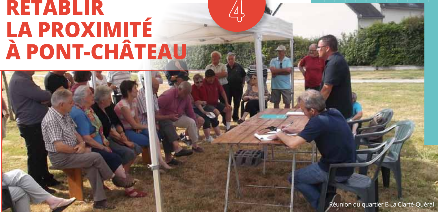
Réunion du quartier B La Clarté-Quéral