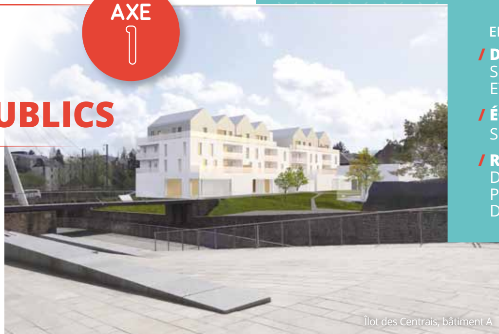
Îlot des Centrais, bâtiment A

Patrimoine : Rénovation du « Café des touristes ».