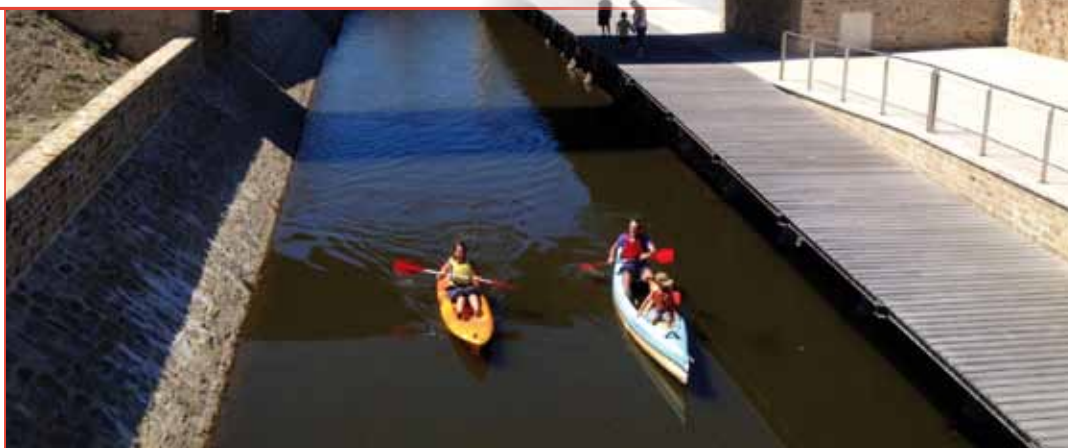
ACTION RÉALISÉE Mercredis du Brivet