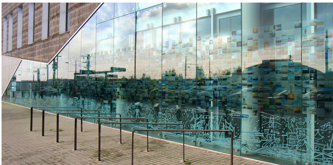
Fresque sur la façade du bâtiment Françoise-Hélène Jourda, siège de Loire-Atlantique développement et du CAUE, au 2 boulevard de l'Estuaire sur l'Île de Nantes. Visible jusqu'à l'été 2019.